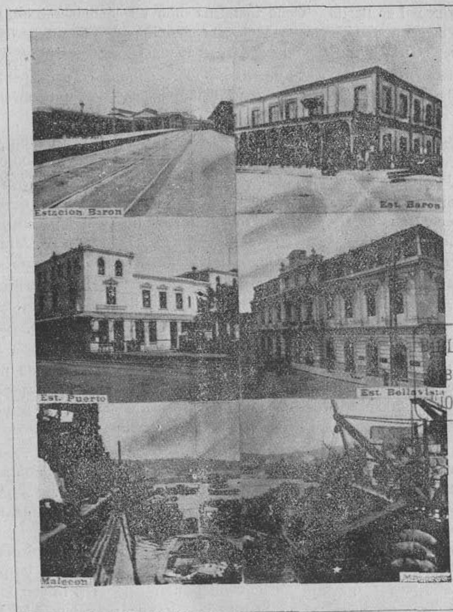
Estaciones del Ferrocarril y Malecones

Banco Anglo Sud-Americano. —Esta institución fué fundada primeramente con el nombre de "Tarapacá y Londres" que cambió después por el de "Tarapacá y Argentina" y últimamente por el del