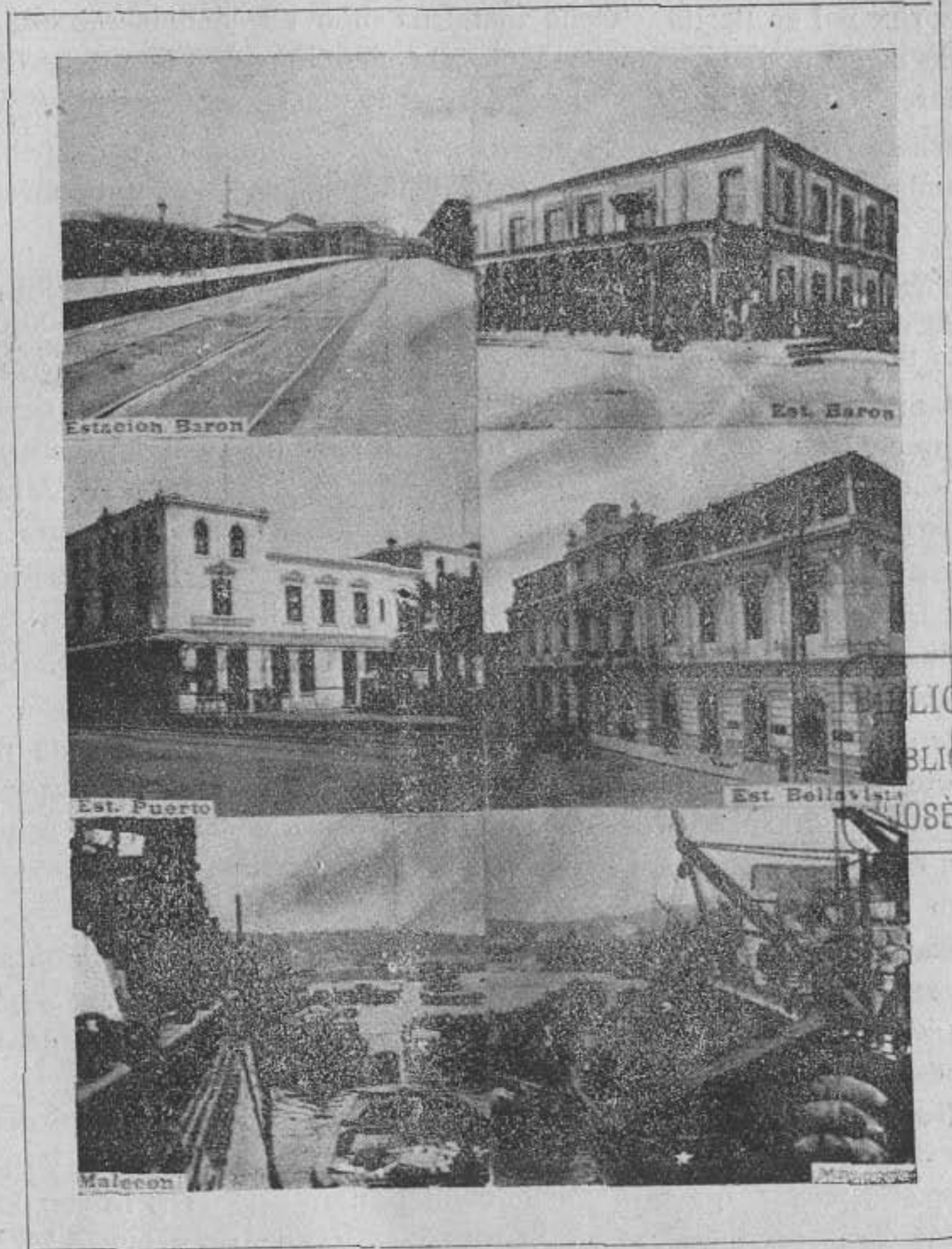
Estaciones del Ferrocarril y Malecones

que hoy lleva. Su capital suscrito es de £ 2.000,000.00. Su oficina principal está en Londres con sucursales en las principales capitales de provincia de Chile.