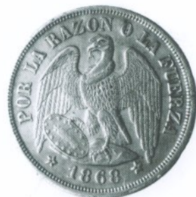
250. 1 Peso 1868 Reverso