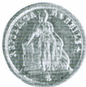
85. 1 Peso 1860 Anverso

El año 1851 se abandonó el sistema monetario español, adoptándose el sistema decimal de origen francés. Los ocho escudos se transformaron en diez pesos. La denominación peso para la moneda de oro perdura hasta hoy. Incluso entre 1960 y 1975, cuando la moneda chilena adoptó la denominación de escudo, se siguió acuñando pesos de oro.