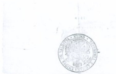
2. 8 Reales 1840 Reverso