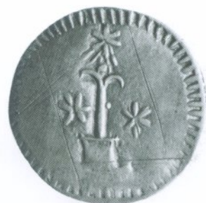
118. 2 Reales 1822 Anverso