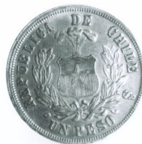
250. 1 Peso 1868 Anverso