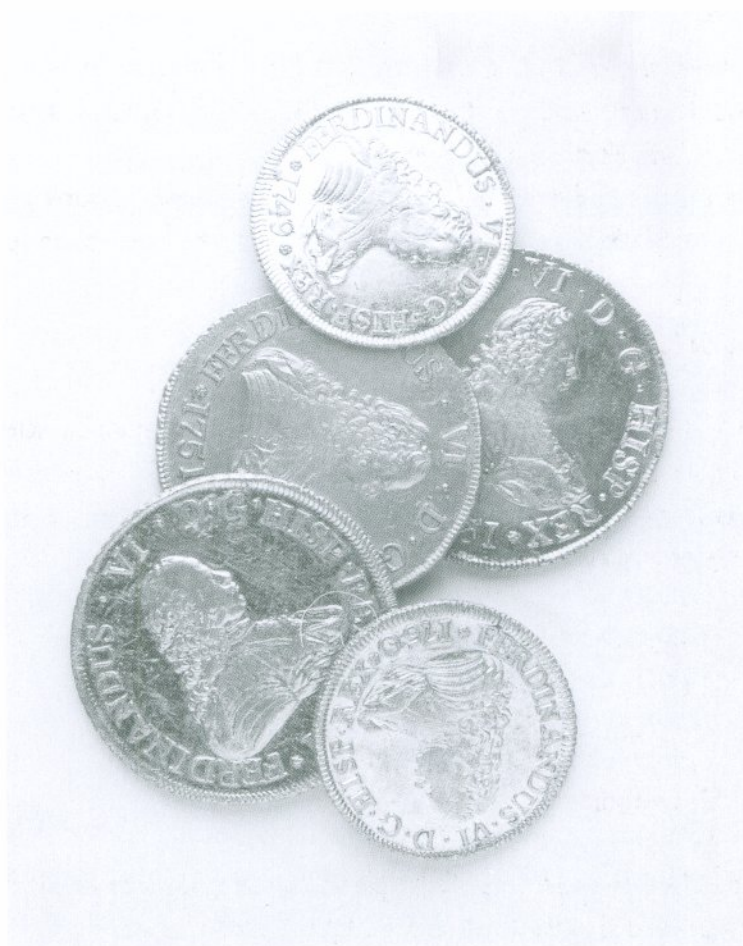
Monedas de oro de la colección del Banco Central de Chile acuñadas entre los años 1749 y 1751