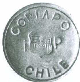
298. 1 Peso 1865 Anverso