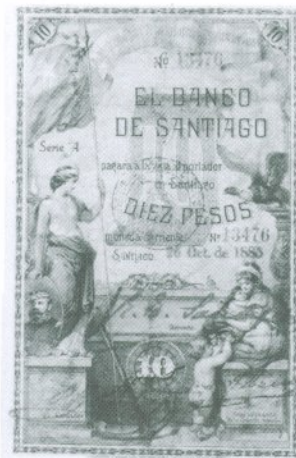
10. 10 Pesos 1885 Anverso

Desde el año 1879 el Fisco emitió regularmente billetes de banco. Durante el período de emisión de bancos particulares, las emisiones fiscales circularon paralelamente. Han existido tres series fiscales. La primera, entre los años 1879 y 1882; la segunda entre los años 1883 y 1896, ambas encargadas a American Bank Note Company Ltd.; y la tercera, entre los años 1898 y 1919, estos últimos billetes fueron encargados a American Bank Note Company Ltd. y a Waterlow & Sons.