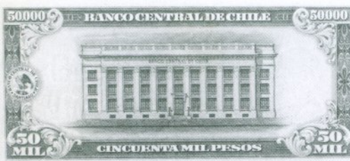
37. 50.000 Pesos Reverso