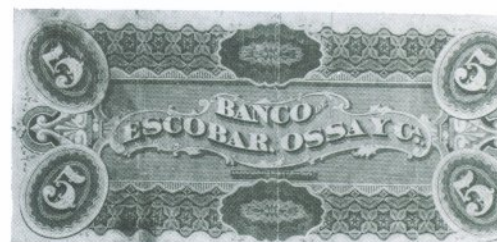
25. 5 Pesos Reverso

Fundado el 2 de agosto de 1866 y como Banco emisor desde el 24 de noviembre de 1871. Emitió billetes de 5, 10, 20, 50 y 100 pesos. Encargó sus emisiones a ABN.