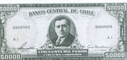
37. 50.000 Pesos Anverso

Desde el año 1958 todos los billetes llevan el pie de imprenta «Casa de Moneda de Chile».