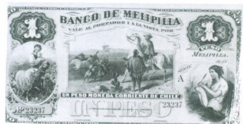
28. 1 Peso Anverso

Fundado y autorizado para emitir el 3 de enero de 1879. Emitió billetes de 1, 5, 10 y 20 pesos. Encargó sus emisiones a ABN.