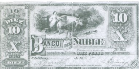
4. 10 Pesos 1895 Anverso

5. 1 PESO S/F 7. 10 PESOS S/F 6. 5 PESOS S/F