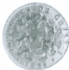
23. 8 Escudos 1835 Anverso