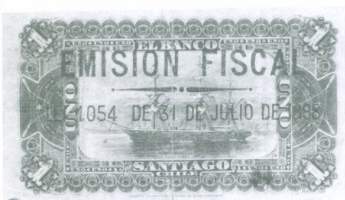
13. 1 Peso - Banco de Santiago Reverso

La crisis económica del año 1898 llevó al Gobierno a decretar la inconvertibilidad de los billetes de banco (Ley del 31 de julio de 1898), revocando a los bancos particulares su licencia para emitir billetes, función que fue asumida por el Fisco. Se procedió a incautar los billetes ya impresos, los que fueron timbrados en el reverso con la leyenda EMISION FISCAL / LEI 1054 DEL 31 DE JULIO DE 1898.