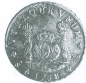
1. 8 Reales 1758 Reverso