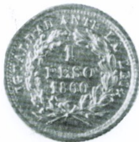
85. 1 Peso 1860 Reverso