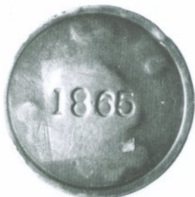
298. 1 Peso 1865 Reverso

El año 1926 se acuñaron algunas monedas de prueba que muestran un cambio radical en el diseño, sustituyendo el cóndor por un mapuche. Esta modificación nunca se trasladó a la moneda circulante.