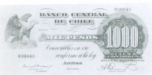
29. 1.000 Pesos 1929 Anverso

Billetes de la Imprenta Fiscal remarcados por el Banco Central el 10 de diciembre de 1925