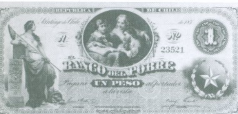
5. 1 Peso Anverso