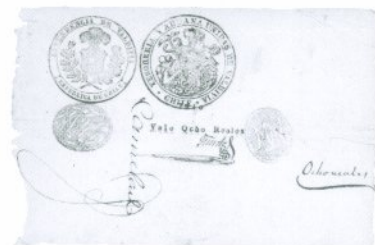
2. 8 Reales 1840 Anverso