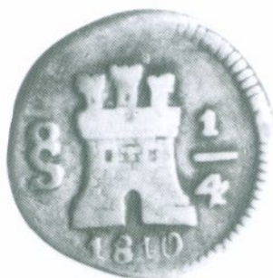
73. 1/4 Real 1810 Anverso