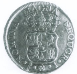
1. 4 Escudos 1749 Reverso