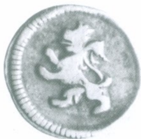
73. 1/4 Real 1810 Reverso