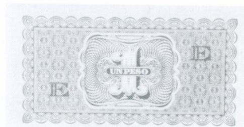
11. 1 Peso 1943 E Reverso