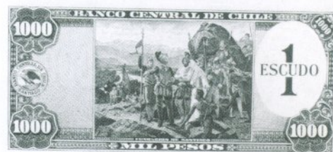
9. 1 Escudo Reverso

Con el objeto de simplificar las contabilidades, otorgar mayor consideración a la moneda chilena en el ámbito internacional y fortalecer la confianza de la población, se reformó la paridad y el signo monetario.