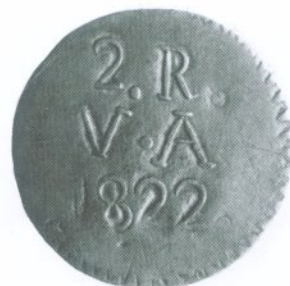
118. 2 Reales 1822 Reverso