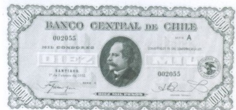
30. 10.000 Pesos 1932 Anverso