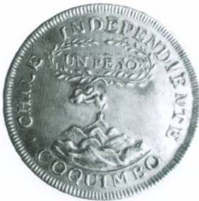
140. 1 Peso 1828 Reverso

Desde 1834 las monedas de plata debieron llevar el escudo de Chile y un cóndor rompiendo cadenas, con las leyendas REPUBLICA DE CHILE además de POR LA RAZON Y LA FUERZA.