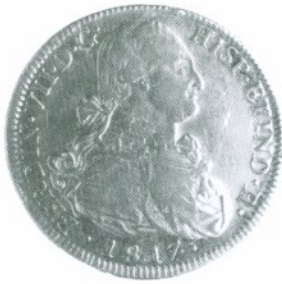
49. 8 Escudos 1817 Anverso