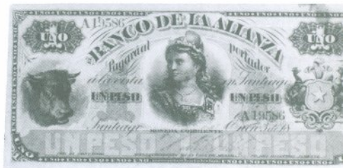
6. 1 Peso Anverso