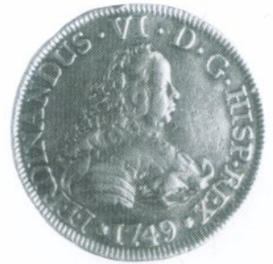
1. 4 Escudos 1749 Anverso