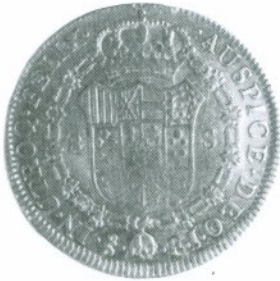
49. 8 Escudos 1817 Reverso