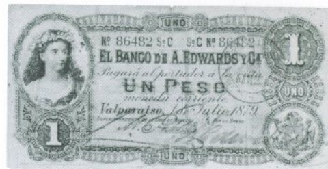
22. 1 Peso 1879 Anverso

Fundado el 5 de enero de 1867. La ley de inconvertibilidad de 1878 fijaba para éste en 2.160.000 pesos la cantidad a emitir en billetes inconvertibles. Este Banco lanzó tres series diferentes. La primera, en 1871; la segunda, entre 1875 y 1880, y la tercera (fallida), en 1895. Primera emisión: 1 (dos tipos), 5, 10 20 y 50 pesos. William Brown (WB). Segunda emisión: 1, 5, 10 y 100 pesos. (B&W). Tercera emisión: 1 y 10 libras. (B&W)