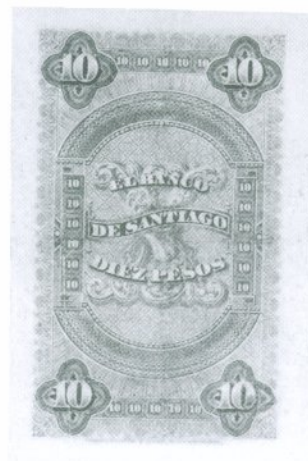
10. 10 Pesos 1885 Reverso