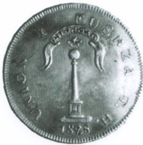
140. 1 Peso 1828 Anverso