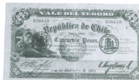
2. 50 Pesos Anverso