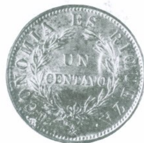
6. 1 Centavo 1835 Reverso