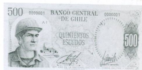
17. 500 Escudos Anverso