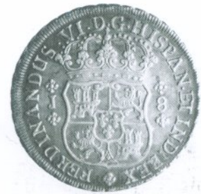
1. 8 Reales 1758 Anverso