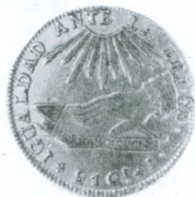
23. 8 Escudos 1835 Reverso